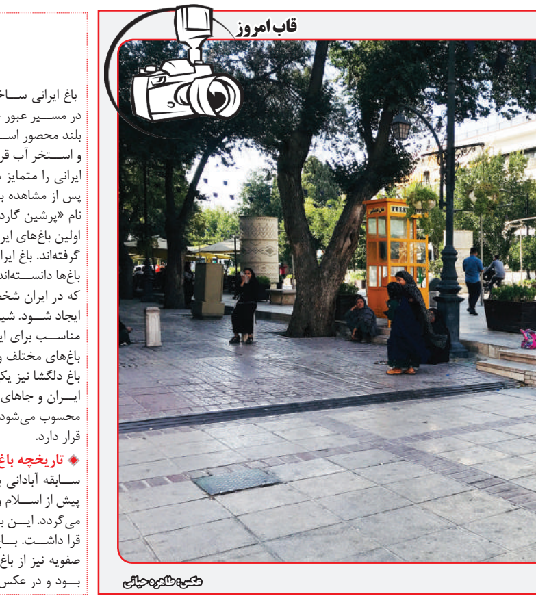
متکدیان و فالگیران در اماکن گردشگری

باغ ایرانی ساختار و طراحی منحصربه‌فردی دارد: در مسیر عبور جوی آب قرار دارد، با دیوارهای بلند محصور است و در داخل باغ عمارت تابستانی و استخر آب قرار دارد. این سه مشخصه، باغ‌های ایرانی را متمایز می‌کند. در واقع جهانگردن اروپایی پس از مشاهده باغ‌های ایرانی، آن‌ها را با مشخصه و نام «پرشین‌گاردن» وصف کردند. اولین باغ‌های ایرانی در مسیر خروجی قنات‌ها شکل گرفته‌اند. باغ ایرانی پاسارگاد را ریشه معماری این باغ‌ها دانسته‌اند. کوروش کبیر اولین شخصی است که در ایران شخصاً دستور داده بود که باغ پاسارگاد ایجاد شود. شیراز با داشتن آب و هوا و سرزمینی مناسب برای ایجاد باغ، شهری است که دارای باغ‌های مختلف و زیبای ایرانی است. باغ دلگشا نیز یکی از باغ‌های تاریخی ایران و جاهای دیدنی استان فارس محسوب می‌شود که در شمال شرقی شیراز قرار دارد. ◆ تاریخچه باغ دلگشا سابقه آبادانی باغ دلگشا به زمان پیش از اسلام و دوران ساسانیان بازمی‌گردد. این باغ در نزدیکی کهنه‌دژ قرار داشت. باغ مذکور در دوران صفویه نیز از باغ‌های مهم و تفریحی بود و در عکس‌های گردشگران