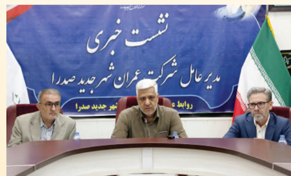
روابط: مدیرعامل شرکت عمران شهر جدید صدرا

مدیرعامل شرکت عمران شهر صدر در نشست خبری به راه‌اندازی کتابخانه بزرگ صدرا با عنوان باغ کتاب اشاره کرد و گفت: این مرکز فرهنگی در زمینی به مساحت ۴۵۰ مترمربع با زیر بنای ۴۸۰۰ و با ۲۰ میلیارد و ۲۰۰ میلیون تومان در حال بتن‌ریزی است.