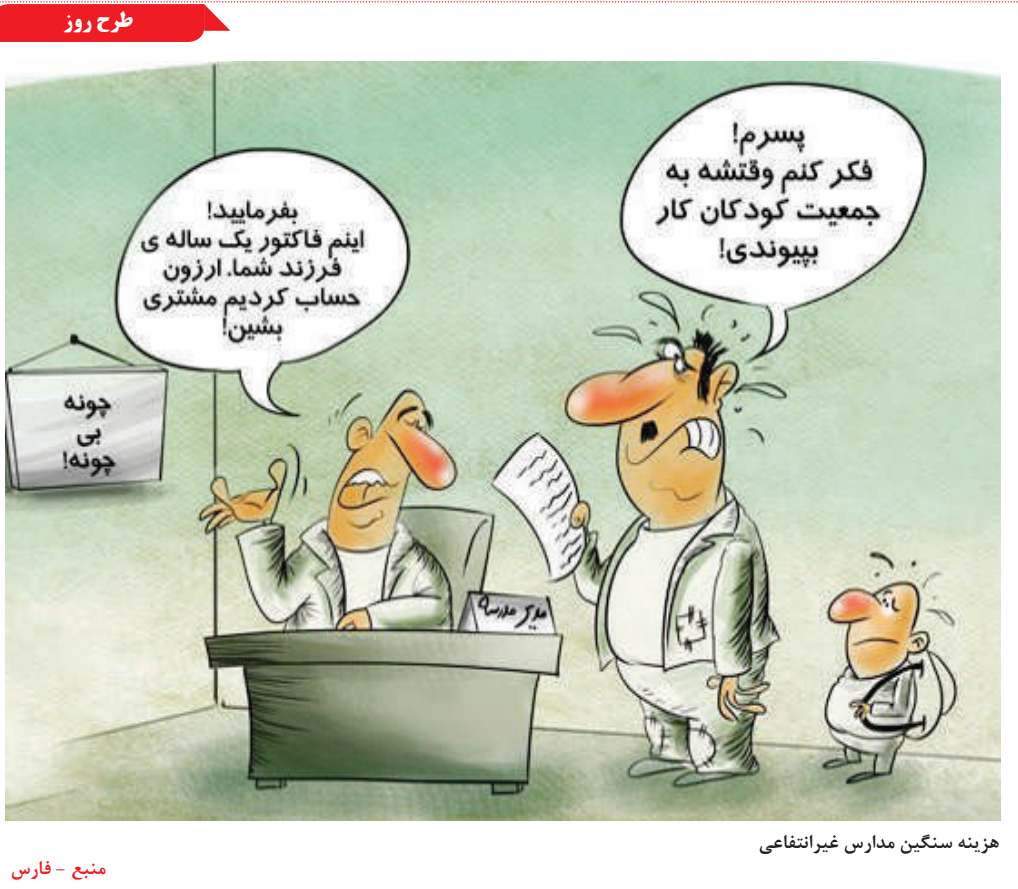
هزینه سنگین مدارس غیرانتفاعی

دو واکسن ضدسرطان mRNA مستجر (mRNA)، با استفاده از همان فناوری واکسن ضدکرونا پس از اینکه محققان نتایج امیدوارکننده‌ای را در مطالعات قبلی گزارش دادند، به مرحله بعدی آزمایشات بالینی رسیدند. مادرنا و مرک به تازگی از شروع آزمایش فاز سوم واکسن ضد ملانوما (mRNA-4157) را اعلام کردند، در حالی که واکسن ضدسرطان لوزالمعدیه بیونتک، (BNT1۲۲)، وارد آزمایش فاز II می‌شود. برای ایجاد واکسن‌های ضدسرطان شخصی، دانشمندان از نظر ژنتیکی نمونه‌های را از تومور